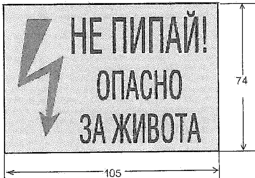
Приложение №2: Табела за безопасност за врата на табло тип „ТЕМО“